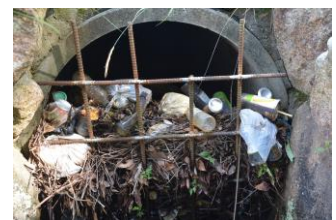
堂々公園内のマンホール出口