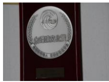
日本水環境学会 水環境文化賞受賞