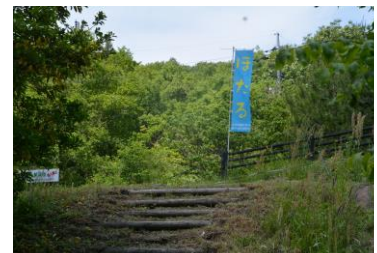
ホタルがたくさん飛んだ5番川原