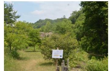
安全啓蒙看板を掛ける