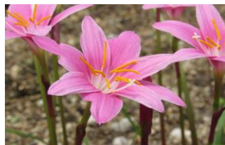
彼岸花科サフランモドキ