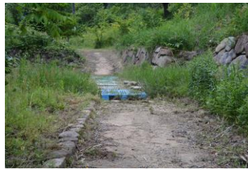
観賞者の安全を願い橋に橋を架ける