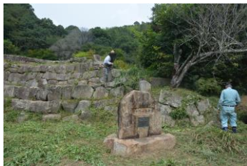
日本最古？砂留の整備