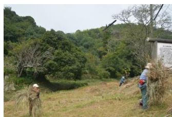
1番砂留刈り取りの草処理