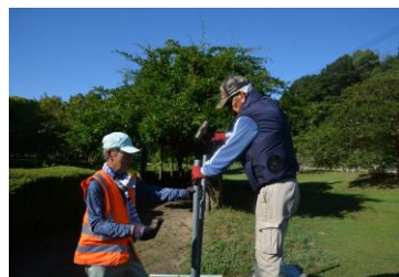
啓蒙看板取り付け中