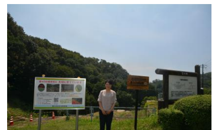
「ホタルと花と砂留と」の活動