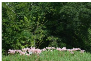
1番砂留左岸広場の夏水仙