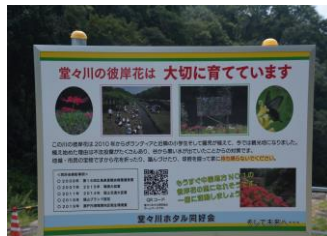
基金を使って作った看板