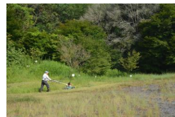
彼岸花の開花を促す草刈り