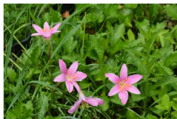
6月開花のサフランモドキ