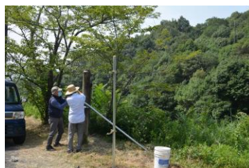
1番砂留広場等を監視するカメラ