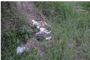
捨てた人の車の番号わかる？