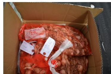
8月23日植栽 花色追加