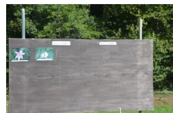
5番川原に掲示の花色