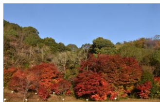
1番砂留奥の紅葉 昨年12月1日姿