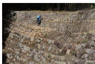
鳶が迫る砂留整備 役員