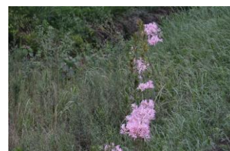
5番砂留下方斜面ナツヅイセン