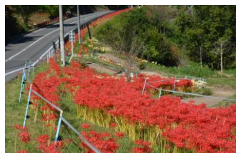
5番川原の彼岸花 昨年10月1日の姿