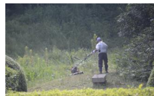
役員ハンマー式で草刈り