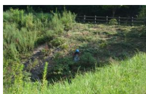
会長蔭ヶ迫砂留最下流草刈り