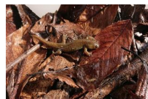
セトウチサンショウウオ