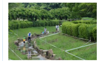
23年7月の堂々川小川水浴び