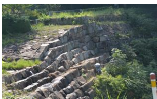
6番砂留草木の伐採