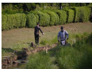
彼岸花が咲く場の草刈り