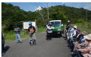
朝8時全員集合で会長挨拶