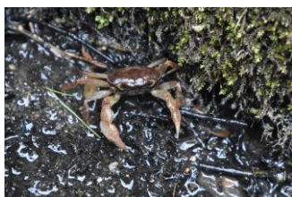
堂々川きれいな水に棲むサワガニ