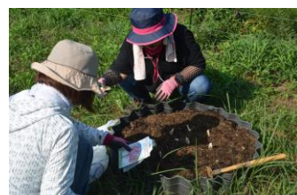
ダイヤモンドリリー植栽