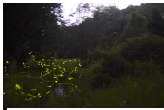
22年5月番砂留川原を飛翔