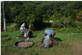
花壇造りを始めています