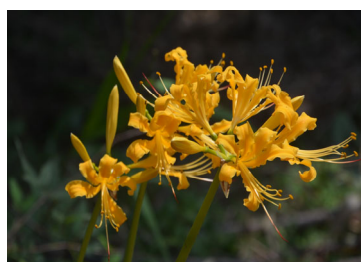
リコリス・オオレア