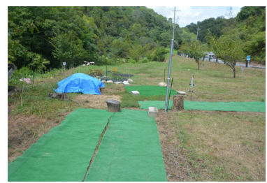
1番砂留東広場の整備