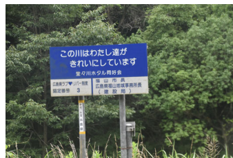
ラブリバー認定3 平成17年度